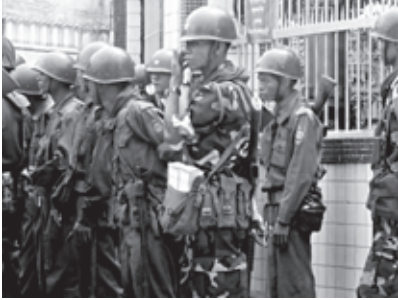
စက်တင်ဘာ ၂၇၊ ၂၀၀၇ တွင်ဆန္ဒပြသူများအားနှိမ်နှင်းရန် ပြင်ဆင်နေသည့်ရန်ကုန်မြို့အတွင်းစစ်သားများပုံ

ခြင်းများပြုလုပ်ပြီးတ ချိန်တည်းမှာပင် သံဃာ တော်များနှင့် မိမိမှသံသယဖြစ်သူများကို ရိုက်နှက်ခြင်း၊ လိမ်ခေါ်သွားခြင်း၊ အချို့မှာ အစအနဂ္ဂမရဘဲပျောက်ကွယ်သွားခြင်းများရှိခဲ့ ပါသည်။ ၁၉၆ နအဖ သည်သံဃာတော်များအား သင်္ကန်းချွတ်စေပြီး ဗုဒ္ဓဘာသာအသိုင်းအဝိုင်း များဖြင့် နှင့် ဆက်နွယ်ခြင်းများကိုဖြတ် တောက်စေခဲ့ပါသည်။ အောက်တိုဘာလတွင် လူ့အခွင့်အရေးများဆိုင်ရာအဖွဲ့ အစည်းများမှ ဆန္ဒပြပွဲတွင်ပါဝင်ခဲ့သည်ဟု သံသယရှိသူ အယောက် ၆၀၀၀ အားဖမ်းဆီးခဲ့သည်ဟု ခန့်မှန်းရပါသည်။ ၁၉၇ ဘုန်းကြီးကျောင်းများသည် ယနေ့ထိတိုင်ပင် ဟာလာဟင်းလင်းရှိနေဆဲ ဖြစ်ပြီး၊ စစ်အစိုးရမှအမြဲတမ်းထောက်လှမ်း စောင့်ကြည့်နေဆဲဖြစ်သကဲ့သို့ ရာပေါင်းများ စွာသော သံဃာတော်များနှင့် ဆန္ဒပြသူများ လည်း အကျဉ်းထောင်ထဲတွင် ရှိနေရဆဲပင် ဖြစ်ပါသည်။