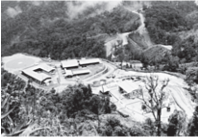
ထိုင်း-မြန်မာနယ်စပ်တွင်တည်ရှိသောရာတနာပိုက်လိုင်း အဆောက်အအုံ

အထူးအစည်းအဝေးကို ၁၉၉၂ နှစ်မှစ၍ ယခုအချိန်အထိ နှစ်စဉ်ခေါ်ယူကျင်းပခဲ့ပါသည်။ ၁ စစ်အစိုးရ၏ “အဆက်မပြတ်ဖြစ်နေသော လူ့အခွင့် အရေးဆိုင်ရာချိုးဖောက်မှုများ၊ ပြည်တွင်းစစ်အပါအဝင်၊ နိုင်ငံရေးဆိုင်ရာများ၊ စီးပွားရေး၊ လူမှုရေးနှင့် ယဉ်ကျေးမှု ဆိုင်ရာ အခွင့်အရေးများ၊” “အကြောင်းမဲ့တရားစွဲ သတ်ဖြတ်ခြင်း၊ စစ်တပ်အဖွဲ့ဝင်များမှ မုဒိမ်း ကျင့်ခြင်းနှင့် အခြားသောနည်းမျိုးစုံဖြင့် လိင်ပိုင်းဆိုင်ရာ အကြမ်းဖက်ခြင်းများ၊ အဆက်မပြတ်ညှဉ်းပမ်းနှိပ်စက်ခြင်း၊ ချုပ်နှောင် သတ်ဖြတ်မှု၊ နိုင်ငံရေးဆိုင်ရာပုဂ္ဂိုလ်များအား အဆက်မပြန် ဖမ်းဆီးခြင်းနှင့် ထောင်ချမှုများ၊” “အဓမ္မရွှေ့ပြောင်း စေခြင်းများ၊” “အဓမ္မ စေခိုင်းခြင်းနှင့် ကလေးများအား အဓမ္မ စေခိုင်းခြင်း” များအား ၂၀၀၆ ခုနှစ်တွင်ကျင်း ပခဲ့သော အထွေထွေညီလာခံ အစည်းအဝေးမှ ဤလုပ်ရပ်များအပေါ် “လေးနက်သော စဉ်းစားဆင်ခြင်မှုအရေးကိစ္စ” တစ်ခုဖြစ်သည်ဟု ဖော်ပြခဲ့ပါသည်။ ၂