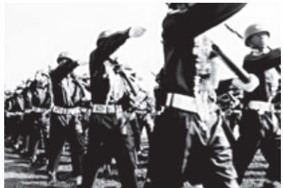
စစ်သားများချီတက်နေသည့်

ဒီမိုကရေစီလှုပ်ရှားသူ များအပေါ်နှိမ်နှင်းမှုနှင့် နောက်ပိုင်းတွင် လူထောင်ပေါင်းများစွာကို ဖမ်းဆီးခဲ့သည်သာမက ထိန်းသိမ်းပြီးသတ်ဖြတ်မှု၊ အကြောင်းမဲ့တရားစွဲသတ်ဖြတ်မှု၊ မုဒိမ်းကျင့်မှု၊ ညှဉ်းပမ်းနှိပ်စက်မှုနှင့် တိုင်းရင်းသားလူမျိုးများ စုငယ်များအား တိုက်ခိုက်မှု၊ အဓမ္မရွှေ့ပြောင်းစေမှုများနှင့် ကလေးငယ်များအား ကလေးစစ်သားအဖြစ် အတင်းအဓမ္မစုဆောင်းခြင်းများ ပြုလုပ်ခဲ့ကြောင်း ၆ အစီရင်ခံစာမှ ရှုတ်ချမှုများ တင်ပြခဲ့ပါသည်။ ၂၀၀၇ ခုနှစ် စက်တင်ဘာလအတွင်း စစ်အစိုးရမှ ပြုလုပ်ခဲ့သော “ရိုက်နှက်ခြင်း၊ သတ်ဖြတ်ခြင်း၊ မတရားဖမ်းဆီးထောင်ချခြင်းနှင့် တရားမဲ့သတ်ဖြတ်ခြင်း” ၇ လုပ်ရပ်များ အပေါ်အဖြေရှာပြီး ဆုံးဖြတ်ချက်ချရန် အပြည်ပြည်ဆိုင်ရာ လူ့အခွင့်အရေးများကောင်စီမှ အစည်းအဝေးတရပ် ပြုလုပ်ခဲ့ပါသည်။ ဤသို့ စစ်အစိုးရ၏ဖိနှိပ်မှုများအပေါ် အဖြေရှာဆုံးဖြတ်ချက်ချနိုင်ရန် လူ့အခွင့်အရေးများဆိုင်ရာ ကော်မရှင်နှင့် ယခင်က ဤအစည်းအဝေးများတွင်ပါဝင်ခဲ့သော ပုဂ္ဂိုလ်များနှင့်အတူ