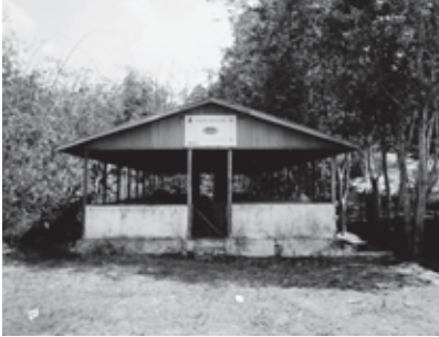
မီးချောင်းလောင်းကျေးရွာတွင်းစွန့်ပစ်ထားသည့်ဝက်မွေး မြူရေးခြံ တိုတယ်စီမံကိန်းအမှတ်အသားပါရှိသည်။

၂၀၀၅ တွင်ရွာ ၂၅ ရွာအဖြစ်တိုးချဲ့ခဲ့သည်။ ၁၃၄ သို့သော်လည်း ၎င်းကုမ္ပဏီတို့သည် ပိုက်လိုင်း ဒေသအား အကွက်ချသည့်အခါ ပိုက်လိုင်း နှင့်ကီလိုမီတာအနည်းငယ်အကွာရှိသောရွာများ ကိုသာထည့်တွက်ပြီး ၎င်းပိုက်လိုင်းနှင့်ပိုက်လိုင်း လုံခြုံရေးတပ်များကြောင့် ဆိုးကျိုးခံနေ ရသောများစွာသောရွာများကိုမထည့်သွင်းပေ။