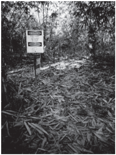
မြန်မာနယ်ပြည်တွင်းရှိရတနာပိုက်လိုင်းမြုပ်နှံထားသည့်ပုံ

စီမံကိန်းတိုးတက်လာသည်နှင့်အမျှ ရတနာစီမံကိန်းပူးပေါင်းလုပ်ဆောင်ရေးအဖွဲ့သည် ရတနာပိုက်လိုင်း ဖြတ်သန်း သွားမည့် ထိုင်းနယ်စပ်အပါအဝင်၊ မြန်မာပြည်တောင်ပိုင်းဒေသအတွင်း ၆၀ ကီလိုမီတာ (၄၀ မိုင်) အကွာအဝေးရှိ သော နယ်ထဲတွင် ဖြတ်သန်းမည့် ရတနာပိုက်လိုင်းအား တည်ဆောက်ရန် ဓါတ်ငွေ့ဝယ်ယူသည့် PTT နှင့် စာချုပ် ချုပ်ဆိုလက်မှတ်ရေးထိုးခဲ့ပါသည်။ ၂၁ တဆက်တည်းတွင် လူ့အခွင့်အရေးဆိုင်ရာလှုပ်ရှားသူများနှင့် ဒုက္ခသည်များ၏ အစီရင်ခံစာအရ ယင်းအချိန်ကာလတွင် ပိုက်လိုင်းဒေသတလျှောက်၌ အဆမတန်များပြားလာသည့် စစ်တပ်များနှင့် လူ့အခွင့်အရေးချိုးဖောက်မှုများသည်လည်း ပိုမိုဖြစ်ပျက်နေကြောင်းကို တင်ပြထားပါသည်။ ရတနာပိုက်လိုင်း၏ လုံခြုံရေးတာဝန်ယူထားသည့်တပ်ဖွဲ့ဝင်များသည် ရွာသားများအား စီမံကိန်းတွင် အဓမ္မစေခိုင်းခြင်း၊ စီမံကိန်း