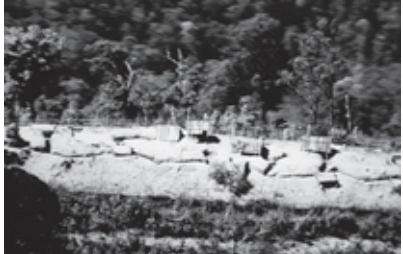
ရာတနာပိုက်လိုင်းအလျှောက်တည်ရှိနေသည့်စစ်တပ်စခန်းများ

မြန်မာစစ်တပ်၏လိုအပ်မှုအားနှောင့် ယှက် အဟန့်အတားဖြစ်စေပါက ဒေသခံ ရွာ သားများကို စစ်သားများမှ ရိုက်နှက်သည့် လုပ်ရပ်များအပါအဝင် ပိုက်လိုင်းလုံခြုံ ရေးတပ်ဖွဲ့မှ ဒေသခံများကိုလူ အများရှေ့၌ အကြမ်းဖက် မှု ကိစ္စများကျူးလွန်လုပ် ဆောင်ခြင်းဖြင့်ဒေသခံပြည်သူလူ ထုများအား အကြောက်တရားများရှိအောင် ခြိမ်းခြောက် ပြသနေခြင်းဖြစ်သည်။ ဓာတ်ငွေ့ ပိုက်လိုင်း လုံခြုံရေးတပ်ဖွဲ့ ၁၀၀၇ နှင့် ၁၀၀၈ ရှိသည့် ဆင့်ခေါ်သည့် လောက်သိုင်းရွာအစည်း