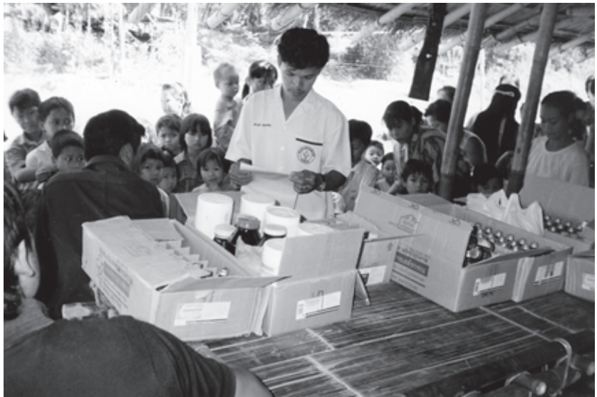
ဒုက္ခသည်စခန်းရှိဆေးပေးခန်းများသည်ပိုက်လိုင်းဒေသရှိရွာသားတော်တော်များအတွက်ဆေးဝါးများရစေသည့်နေ ရာတခုတည်းဖြစ်သည်။

ဟုပြောကြားသွားသည်သာမက ယခင်က ဆရာဝန်မရှိခဲ့သော် လည်း ယခုတွင် ဆရာဝန် ၁၀ယောက်ရှိပြီဖြစ်ကြောင်းပြောဆိုခဲ့ပါသည်။ ၁၄ သို့သော် ERI ၏သုတေသနပြုချက်အရ အချို့နေရာများတွင် အခကြေးငွေပေးရခြင်း သို့မဟုတ်ကျန်းမာရေးကုသမှုမရှိခြင်းရှိနေ ကြောင်းသိရပါသည်။ အမျိုးသမီးတစ်ဦးမှ ဆေးရုံတွင်ဆေးကုသမှုခံယူရန်အကုန်ကျအလွန် များသသည့်အတွက်ကြောင့်နယ်စပ်ရှိဒုက္ခ သည်စခန်းမှဆေးခန်းသို့ထွက်လာပြီးဆေးကုသမှု ခံယူလျှင် မိမိအတွက် အကောင်းဆုံးဖြစ်သည်ဟု ဆိုပါသည်။ “ကွန်မတီ ဆေးရုံမှဆေးကုသဖို့ ငွေအလုံအလောက် မရှိတဲ့အတွက် နယ်စပ်ကို ထွက်လာဖို့ဆုံးဖြတ်လိုက်ပါတယ်။” ၁၅ အခြား သောရွာသားများကလည်း ဆေးရုံတွင် လူနာများတွက် ထိရောက်သောဆေးဝါးများ မရှိကြောင်း ၁၆ လိုအပ်ပါကမိမိတို့မှဆေးရုံ