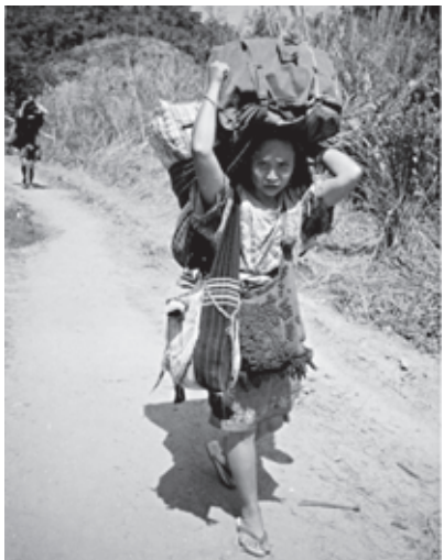
အဆိုးဆုံးမှာစစ်တပ်၏ဖိနှိပ်မှုကြောင့်လူများပြည်တွင်းအိုးပဲ့အိမ်မဲ့ပြေးနေရသည်မှာပိုက်လိုင်းဒေသမှလူများလည်းပါရှိပါသည်။

Chevron သည် ကျန်းမာရေးလုပ်သား ၃၃ ယောက်ကို သင်တန်းပေးခဲ့သည်ဟုဆိုပါသည်။ ဤအကြောင်းမှာ ၄င်းတို့သည် မိမိတို့လုပ်ဆောင်ရန်တာဝန်ရှိကြောင်းနှင့်လုပ်ပေးနေပါသည်ဟု တိုင်းတာဂဏ်ယူနေပါသည်။ ၅၈ တနည်းအားဖြင့်နှိုင်းယှဉ်ကြည့်လျှင် ထိုင်း-မြန်မာနယ်စပ်တစ်လျှောက်ရှိကျန်းမာရေးလုပ်သားများသည် ၁၉၉၈ ခုနှစ်တွင် Back Pack Health Worker Team (BPHWT) ကျန်းမာရေးလုပ်သားအသင်းများကို မြန်မာပြည်တွင်းမှ ရွှေ့ပြောင်းနေထိုင်သူများအတွက်ဆေးကုသမှုပေးရန် ဖွဲ့စည်းခဲ့ပါသည်။ ဤအဖွဲ့သည် ကျန်းမာရေးအသင်း ၃၂ သင်းနှင့် ကျန်းမာရေးလုပ်သား ၁၂၀ ဦးဖြင့် စတင်ဖွဲ့စည်းခဲ့ပြီး ၂၀၀၅ ခုနှစ်တွင် ကျန်းမာရေးအသင်း ၇၀ သင်းနှင့် ကျန်းမာရေးလုပ်သား ၂၅၇ ဦးသို့တိုးမြှင့်ဖွဲ့စည်းလာသည်။ ဤကျန်းမာရေးအသင်းများသည် ရက်စက်ကြမ်းကြုတ်သောစစ် အစိုးရ၏တိုက်ခိုက်မှုမှထွက်ပြေးတိမ်းရှောင်လာသော ပြည်သူလူထု ၁၄၀၀၀၀ ဦး (ရတနာပိုက်လိုင်းဒေသမှမလှမ်းမကမ်းသောရွာသားများလည်း ပါဝင်ပါသည်) ကို ကျန်းမာရေးကုသမှုပေးခဲ့ပါ