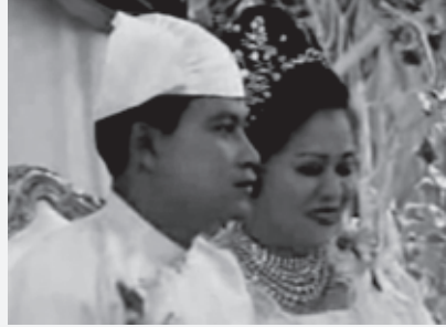
၂၀၀၇ နှစ်တွင်စစ်ဗိုလ်ချုပ်၏သမီးမင်္ဂလာဆောင်သည့် ချိန်တွင်ကျောက်စိမ်းများဖြင့်ချယ်သထား ပြီးစစ်ဗိုလ်တို့မှ မည်မျှကြီးပွား နေသည်ကိုဖော်ပြထားသည်။

အသုံးပြုခဲ့သည့် စာရွက်စာတမ်းများဖြစ်ပြီး ယင်းအမှုကြောင့် လူသိရှင်ကြားကြေငြာရခြင်း ဖြစ်သည်။ ဤသဘောတူညီချက်၏ ချမှတ်ထား သောအချက် အလက်များအပေါ်အခြေခံ၍ တွက်ချက်မှုအရ ၂၀၀၇ အကုန်ပိုင်းတွင် BTU ၁ သန်းလျှင် ဒေါ်လာငွေ ၇ ဒဿမ ၇၀ ဒေါ်လာခန့် ကျသင့်မည်ဟု တွေ့ရှိ ရပါသည်။ ၉၅ ယင်းအား အခြေခံပြီး တွက်ချက်ရာ၌ နေ့စဉ်ဒေါ်လာ ၃ ဒဿမ ၅ သန်းခန့် ရောင်းရသည်ဟု တွက်ချက်နိုင်ပါသည်။ ဈေးနှုန်းများနေ့စဉ်နှင့် အမျှပြောင်းလဲမှုအပေါ် ၂၀၀၇ ခုနှစ်၏အကုန်တွင် ဒေါ်လာ ၁ ဒဿမ ၃ ဘီလီယံခန့် ရရှိမည်ဟု တွက်ချက်ထားပါသည်။