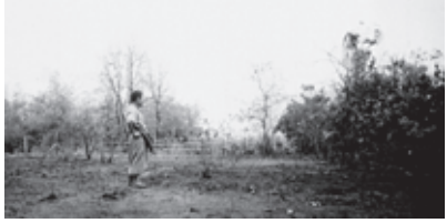
အစိုးရမှအတင်းစိုက်ခိုင်းသည့်မအောင်မြင်သောကြက်ဆူစိုက်ခင်းအားကြည့်နေသည့်လယ်သမားပုံ

ပိုက်လိုင်းဒေသတွင်နေထိုင်သူများအတွက် အဓိကစိုးရိမ်ရသည်မှာ စစ်သားများသည်စိုက်ပျိုးခင်းအတွက် (သို့) စစ်စခန်းများတည်ဆောက်ရန်အတွက် မြေယာများကိုအာဏာဖြင့်သိမ်းယူခြင်းဖြစ်သည်။ စစ်သားများအတွက်ဆန်စပါးစိုက်ပျိုးရန် ရွာသားတစ်ဦး၏လယ်ကွက်ကို သိမ်းယူခြင်း ၁၂ ဆီအုန်းပင်များစိုက်ပျိုးရန် အခြားတစ်ဦး၏မြေကိုသိမ်းယူခြင်း၊ ၁၃ စစ်တပ်စခန်းဆောက်လုပ်ရန် မြေကွက် ဧက ၄၀-၅၀ အထိ သိမ်းယူခြင်းများ ၁၄ ပြုလုပ်ကြောင်းရွာသူရွာမှရွာသားများက ဆိုပါသည်။ အခြားသောပိုက်လိုင်းဒေသရှိ ရွာများလည်းထိုနည်းလည်းကောင်းပင် ရင်ဆိုင်နေရပါသည်။ ၁၅ ဤသည်မှာ ရွာသားတို့၏လယ်မြေများနှင့်စားကျက်များကို ဆုံးရှုံးစေပါသည်။ ရတနာပိုက်လိုင်းနှင့်နီးသော အိန္ဒိရာဇာရွာမှရွာသားတစ်ဦးမှ ကျွန်တော်တို့အား အိန္ဒိရာဇာရွာမှရွာသားတစ်ဦးမှ ကျွန်တော်တို့အား ပေးမြဲခြင်းများမပြုလုပ် နိုင်တော့ ကြောင်း ဤသို့ပြောပြပါသည်။ “စစ်သားတွေ က ရွာသားတွေရဲ့မြေယာအများကြီးကို သိမ်းယူသွားတယ်။ ပြီးတော့ တကယ်လို့ ကျွန်တော်တို့ရဲ့ကျွန်တော်တွေ သူတို့ရဲ့ ဆီအုန်းခြံထဲဝင်ရောက်သွားခဲ့ယင် သူတို့သတ်ပစ်လိုက်တာဘဲ။” ၁၆ အခြား သောရွာသားများသည်လည်း ပိုက်လိုင်း ရှိတပ်ရင်းများ၏ညွှန်ကြားချက်အရ မိမိတို့အား စစ်သားများ၏စိုက်ခင်းထဲတွင် မည်သည့်အခကြေးကိုမျှမပေးသည့်အပြင်သုံးရက်အတင်းအဓမ္မအလုပ်