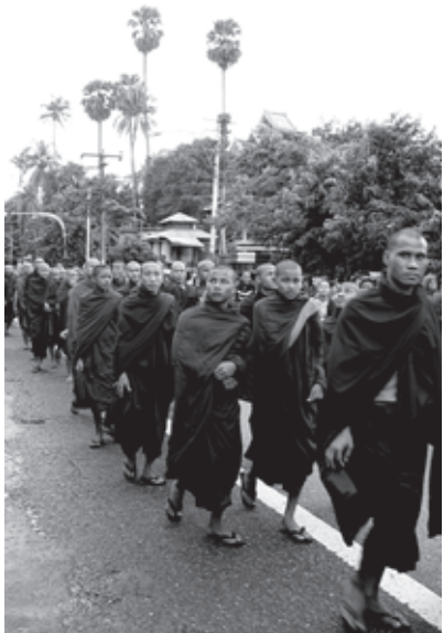
မြို့ရပ်ထုရပ် ရှမ်း

မကြာမီသေးခင်တုန်းက ၂၀၀၇ ခုနှစ် စက်တင်ဘာလတွင်ဖြစ်ပေါ်သော မြန်မာစစ်အစိုးရ၏ပိနိပ်ချုပ်ချယ်မှုကို မလိုလားသောလူထု၏ဆန္ဒပြပွဲသည် အထင်ရှားဆုံးဆန္ဒပြပွဲတစ်ခုဖြစ်ပါသည်။ သံဃာတော်များမှ ဦးဆောင်ခဲ့သောထိုလူထုဆန္ဒပြပွဲသည် နအဖ ၏ပေါ်လစီမူဝါဒများကို မလိုလားကြောင်း မြန်မာပြည်တဝှမ်းလုံးတွင် ဆန္ဒပြခဲ့ခြင်းဖြစ်ပါသည်။ ဤသည်မှာ စစ်အစိုးရမှ လောင်စာဆီဈေးအားအဆမတန်မြင့်တင်မှု၊ သဘာဝဓါတ်ငွေ့၏ဈေးနှုန်းကို ၅၀၀ ရာခိုင်နှုန်းအထိ မြင့်တင်ခဲ့သည်များအပါအဝင် ကုန်ပစ္စည်း တန်ဖိုးများကို အဆမတန်မြင့်တင်ခဲ့သည့်နောက်ပိုင်း ဖြစ်ပေါ်သောဆန္ဒပြပွဲတစ်ခုဖြစ်ကြောင်း သိသာ ထင်ရှားပါသည်။ စစ်အစိုးရသည် သဘာဝဓါတ်ငွေ့ကို ကုပပေး သန်းပေါင်းများစွာ ထိုင်းနိုင်ငံသို့ နေ့စဉ်ရောင်းချပေးနိုင်သော်လည်း ချက်ပြုတ်ရေးနှင့်ဖော်တော်ကားများအတွက်သုံးစွဲနေသော မိမိ၏ပြည်သူများမှာမူ စွမ်းအင်မလုံလောက်ခြင်း၊ဈေးနှုန်းမြင့်သော အခက်အခဲပြဿနာများနှင့် ရင်ဆိုင်နေရသည်။ ၁၉၁ ထို့အပြင်မြန်မာပြည်၏ ပြည်သူများအတွက် အကျိုးမဖြစ်ထွန်းစေသော ရတနာစီမံကိန်းနှင့်အခြားကြီးမားသော ဖွံ့ဖြိုးတိုးတက်မှုစီမံကိန်းများအကြောင့်နှင့်လက်ရှိပြည်သူတို့၏စီးပွားရေးအခြေအနေများကို တိုးတက်ပြောင်းလဲစေရန် ကန့်ကွက်သူများမှဆန္ဒပြပွဲတွင်ဖော်ပြခဲ့ပါသည်။ မြန်မာပြည်တပြည်လုံးတွင် ရက်သတ္တပတ်များစွာ အတွင်းမြို့ကြီးများနှင့်