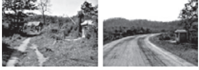
ဓာတ်ပုံ တိုတယ် ဝတ်ဆိုင်မှ ယခင်နှင့်ယခုလက်ရှိ ဇင်းဘားလမ်းမကြီးပုံ

ပိုက်လိုင်းအတွက် “ကင်းတဲတွင်လုံခြုံရေးတာဝန်ယူပေးရကြောင်း” ၁၅ ခြားရွာသားများကလည်း အလားတူပြောပြခဲ့ပြီး ၎င်းဖြစ်ရပ်များ “မကြာခဏ” “အခါပေါင်းများစွာ” ၁၆ ဖြစ်ပွားခဲ့သည်။ ပိုက်လိုင်းဒေသများတွင် နေထိုင်သည့် ဒေသခံပြည်သူလူထုပေါင်း ၅၀၀၀ခန့်ရှိသည်ဟု ရေနံကုမ္ပဏီများမှ ခန့်မှန်းကြသော်လည်း၊ ၁၇ အကယ်၍ အရွယ်ရောက်အမျိုးသားများမှ အတင်းအဓမ္မလုပ်အားပေးစေခိုင်းခြင်းခံရပါက အခိုင်းခံရသည့်အရွယ်ရောက်အမျိုးသားများဦးရေမှာ ၁၆၀၀၀ ခန့်ရှိနေပြီးဖြစ်သည်။ ၁၈ ဒေသတွင်းရှိကျေးရွာတိုင်းတွင် စစ်တပ်မှ အတင်းအဓမ္မလုပ်အားပေး စေခိုင်းခြင်းမခံခဲ့ရပါသော်ညားလည်း၊ ပိုက်လိုင်းလုံခြုံရေးအတွက် ဒေသအတွင်းထောင်ပေါင်းများစွာသောရွာသားများသည် ပုံစံမျိုးစုံသောလုပ်အားစေခိုင်းမှုများခံခဲ့ရသည်။