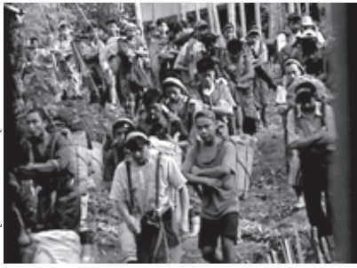
စစ်သုံးအင်္ဂါအာရုံ

အခါတွင် အချိုး ဖောက်ခံသည့်သူများကို လျှော်ကြေးများ ထောက်ပံ့ပေးခဲ့သည်ဟု ပြောဆိုခဲ့သည်။ ၇၆ ၁၉၉၄ ခုနှစ်ကတည်းက အဓမ္မလုပ်အားပေးစေခိုင်းမှု လုပ်ရပ်များ မရှိစေရန် ကုမ္ပဏီအနေဖြင့် စစ်တပ်၏လုပ်ဆောင်မှုများကိုအနီးကပ်စီမံကြီးကြပ်ခဲ့သည့်အပေါ်၊ စီမံကိန်းလုပ်ငန်းအစပိုင်း၌ ဖြစ်ပွားသည့်အဓမ္မလုပ်အားပေးစေခိုင်းမှုလုပ်ရပ်များကို သတိထားခဲ့မှု အားနည်းခဲ့လိမ့်မည်ဟု တိုတယ်ကုမ္ပဏီက ပြောဆိုခဲ့သေးသည်။ ၇၇ ဒေသခံများနှင့် သဘာဝဓာတ်ငွေ့ပိုက်လိုင်းဒေသမှ ထွက်ပြေးလာသည့် ဒုက္ခသည်များအား တွေ့ဆုံမေးမြန်းရာတွင်၊ ၁၉၉၄ ခုနှစ်နောက်ပိုင်းမှ ယနေ့အချိန်ထိ ဓာတ်ငွေ့ပိုက်လိုင်း လိုခြံရေးတပ်ဖွဲ့မှ ဒေသခံရွာသားများပေါ် အဓမ္မလုပ်အားပေးစေခိုင်းမှုနှင့် သတ်ဖြတ်ခြင်း၊ မုဒိန်းကျင့်ခြင်း စသည့် ဆိုးရွားသောလူ့အခွင့်အရေးချိုးဖောက်မှုများသည် ၁၉၉၄ ခုနှစ်မှစ၍ အစဉ်ဖြစ်ပေါ်ခဲ့သကဲ့သို့ ယခုအချိန်ထိ ဆက်လက်ဖြစ်ပေါ်နေကြောင်း ပြောပြပါသည်။